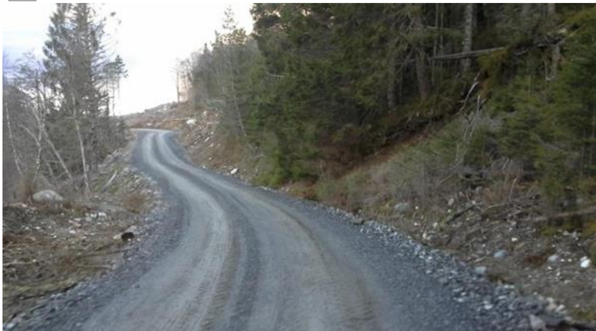
Illustrasjonsbilete av skogsbilveg.