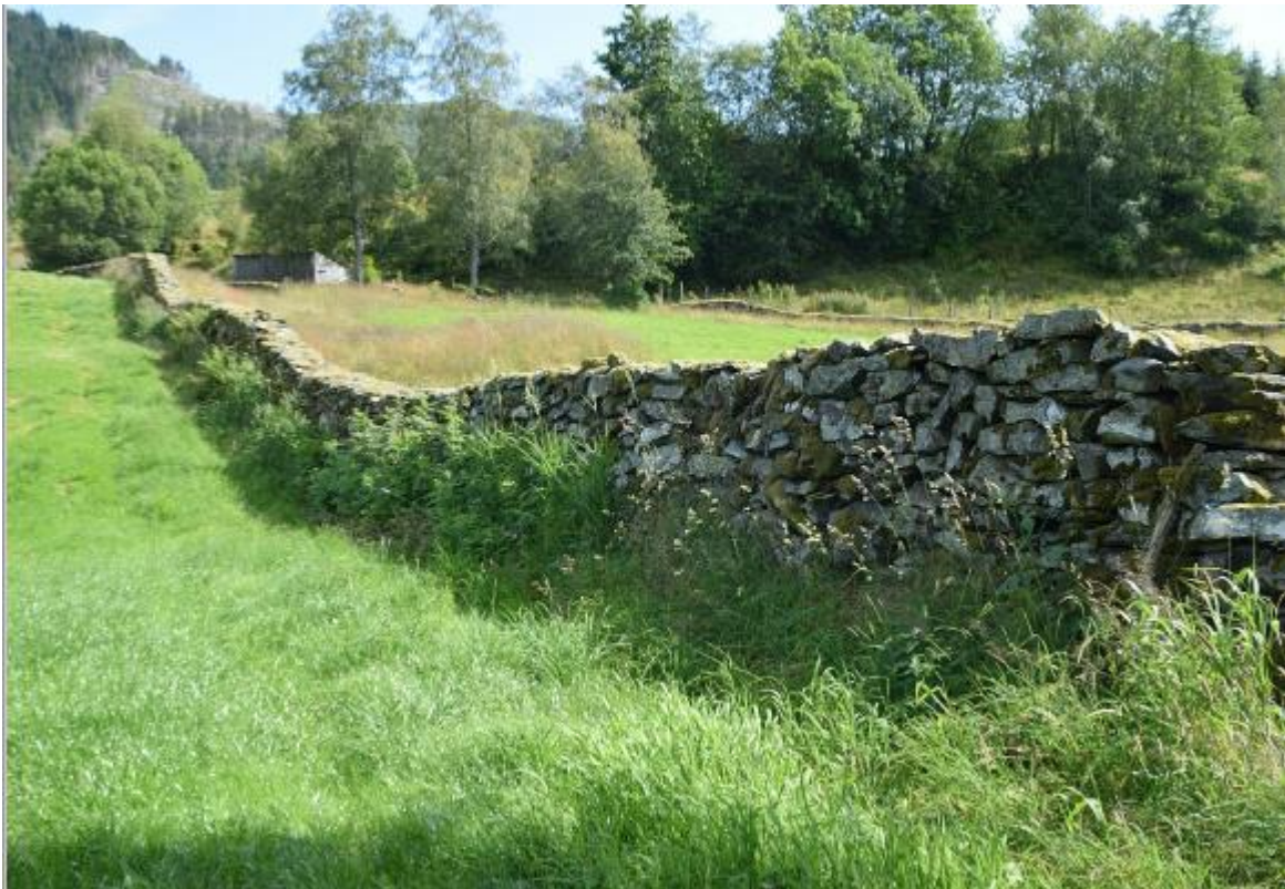
Steingard på Arstein, Straumsnes i Fjaler